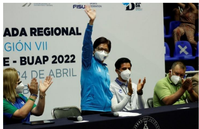
Autoridades presiden la ceremonia de inauguración de Universiada Regional CONDDE R.VII