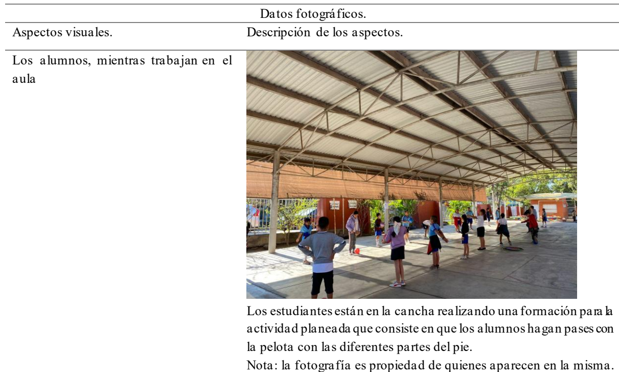
Tabla 2. Instrumento de los datos fotográficos

grupo para trabajar) y la postura del docente. Cabe mencionar que, por cada uno, se tomaron fotografías, para posteriormente agruparlas, y describir lo que se observa en las mismas (Tabla 2).