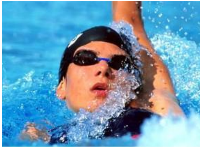
Krisztina Egerszegi en 1992

Los Juegos de 1988 consagraron a Krisztina Egerszegi como la nueva reina de las pruebas de espalda, con un futuro realmente prometedor y en los años que siguieron confirmó los mejores pronósticos.