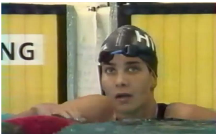
Krisztina Egerszegi en 1992

Krisztina Egerszegi ha sido una de las mejores nadadoras de la historia, aunque no ha tenido el reconocimiento mediático que sus hazañas merecían. Fue un caso extraordinario de precocidad deportiva. Empezó a nadar con apenas 4 años en el club Spartacus en su ciudad natal, y muy pronto sus entrenadores se dieron cuenta de que estaba ante una deportista de cualidades extraordinarias (6).