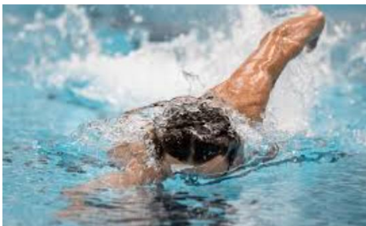
Alexandre Popov en 1999

El 3 de julio dio comienzo una nueva edición del Campeonato Europeo, que también se había celebrado el año anterior. Tras el pasado año que los resultados no le habían acompañado, la incógnita estaba en ver si sería capaz de ganar antes de los Juegos Olímpicos. En las clasificatorias rusas se clasificó brillantemente incluyendo un récord del mundo de 50 metros, con un tiempo de 21.64. Y en el europeo, una vez más se impuso en sus dos pruebas, los 50 y los 100 metros libres, por delante en ambas de Pieter van den Hoogenband. Además de esos dos oros obtuvo otros dos con el equipo ruso en los relevos 4x100 metros libres y estilos (8).