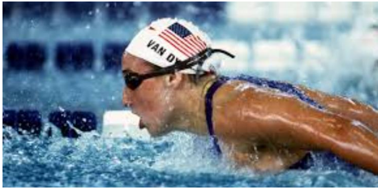
Amy Van Dyken nadando mariposa 1999

Su despedida de la alberca tuvo lugar en los Juegos Olímpicos de Sydney 2000, con 26 años. Allí no consiguió subir al podio de los 50 metros libres por unas pocas centésimas, y tuvo que conformarse con el cuarto puesto. Sin embargo, si ganó con su país en las pruebas de relevos de 4x100 libres y 4x100 estilos, batiendo en ambas el récord del mundo. De esta manera se cerraba una muy brillante trayectoria olímpica.