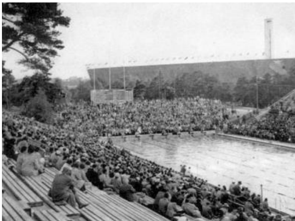
Estadio de natación para los juegos de 1952 (7)

Con respecto a natación, el equipo varonil de los Estados Unidos va ganando terreno, gana la mayoría de los eventos y el relevo, sin embargo, con respecto a las damas, el equipo de natación de Hungría, hizo lo propio dominando las pruebas femeninas.