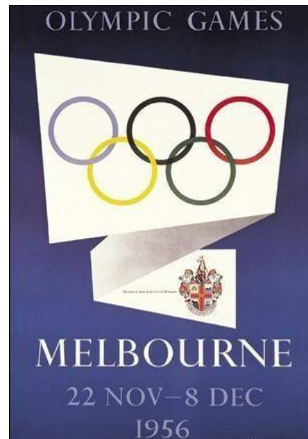
Cartel de los Juegos Olímpicos de Melbourne 1956 (8)

Los juegos olímpicos en Melbourne, Australia en 1956, demostraron la valoración del acondicionamiento físico. El equipo anfitrión para esos juegos tenía un éxito fantástico debido a su programa de entrenamiento y no a su técnica del movimiento. Los entrenadores americanos de natación comenzaron a adoptar métodos de entrenamiento como estos, usando entrenamientos en pista para ayudar a los nadadores. La investigación actual se centra en las fuerzas que actúan en un cuerpo que se mueve a través del agua, la ciencia de la hidrodinámica. Y las nuevas tecnologías aparecen en la natación con una pantalla digital con cronómetro semiautomático.