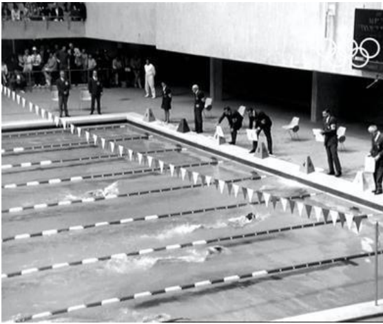
Debbie Meyer durante la prueba de libre en 1968 (16)

Por su parte la nadadora Jan Henne realizó un tiempo de 1:00.0 en 100 metros libres femenino sin poder superar la marca de Dawn Fraser.