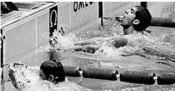
Felipe “el Tibio” Muñoz ganando los 200 metros pecho en 1968 (17)

Pero sin duda, para México, el mayor logro fue la medalla de oro de Felipe “el Tibio” Muñoz, con 17 años de edad, sorprendió al mundo entero ganando el título olímpico en la prueba de 200 metros braza, ya que no era favorito a pesar de haber obtenido el mejor tiempo en las series de clasificación. Al final de la prueba, El Tibio venció al favorito mundial, el soviético Vladimir Kosinsky, cuando faltaban 25 metros de distancia. Terminó la prueba con un tiempo de 2 minutos 28 segundos y 7 centésimas de segundo. Muñoz se convirtió en el primer y único nadador mexicano en ganar una medalla de oro olímpica en natación.