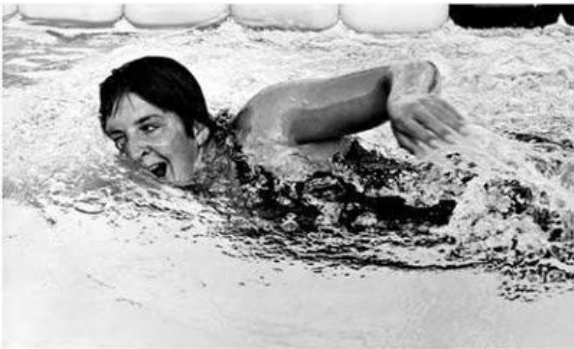
Dawn Fraser en la década de los sesenta (11)

En los relevos 4x100 libres, Estados Unidos se hace con el oro, y Australia con la plata, con Fraser abriendo el relevo de Australia. Este mismo resultado se repetirá en los relevos 4x100 estilos, en la primera vez que se disputó la prueba en unos Juegos.