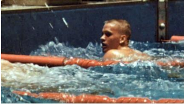
Don Schollander ganando en Tokio 1964 (13)

que posteriormente fue aceptado como el emblema oficial de los Juegos.