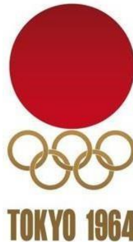
Cartel de los Juegos Olímpicos de 1964 (12)

El cartel se compone de los anillos olímpicos súper puestos en el emblema de la bandera nacional de Japón, lo que representa el sol naciente. Habiendo examinado un gran número de propuestas, el Comité Organizador de los Juegos eligió el diseño presentado por Yusaku Kamekura