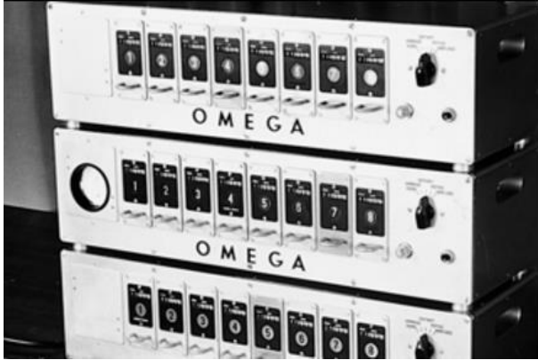
Pantalla digital con cronómetro semiautomático 1956 (9)