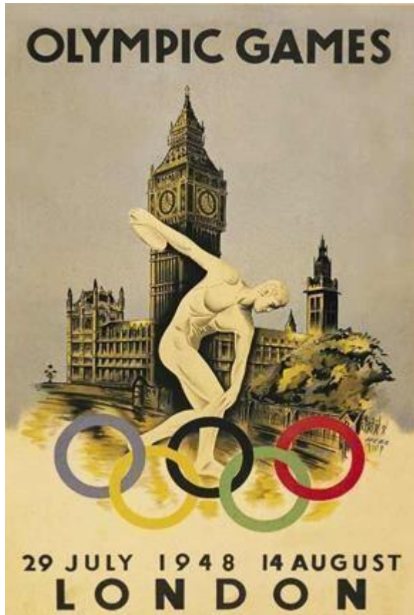
Cartel de los Juegos Olímpicos de Londres 1948 (5)

En su cartel promocional de los Juegos Olímpicos, se muestra al fondo, la Casa del Parlamento y el característico "Big Ben" señalando las 4, hora que se realizó la ceremonia de inauguración de los juegos, seguido de los aros olímpicos. También aparece el dibujo de la estatua del "Discóbolo" (icono clásico del lanzador de disco de la antigua Grecia). Había 100.000 copias realizadas, 50.000 de gran formato y 25.000 pequeñas.